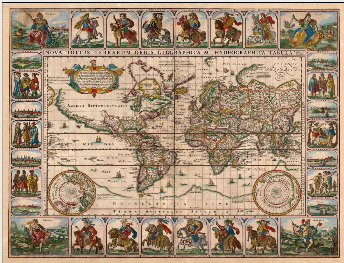
G. Blaeu - siglo XVII

Antes que el sueño (o el terror) tejiera mitologías y cosmogonías Antes que el tiempo se acuñara en días, el mar el siempre mar, ya estaba y era.